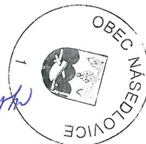
Vlasta Mokrá starostka