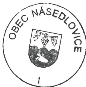
Vlasta M o k r á

Záměr obce o prodej nemovitého majetku bude podle § 39 odst. č. 1 zákona č.128/2000 Sb., o obcích zveřejněn nejméně po dobu 15-ti dnů před jeho projednáním obecním zastupitelstvem. Občané se mohou k tomuto záměru vyjádřit, popř. předložit své připomínky na Obecním úřadě v Násedlovicích.