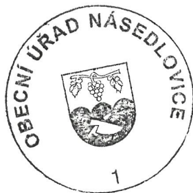
Vlasta M o k r á

Záměr obce o prodej nemovitého majetku bude podle § 39 odst. č. 1 zákona č.128/2000 Sb., o obcích zveřejněn nejméně po dobu 15-ti dnů před jeho projednáním obecním zastupitelstvem. Občané se mohou k tomuto záměru vyjádřit, popř. předložit své připomínky na Obecním úřadě v Násedlovicích.