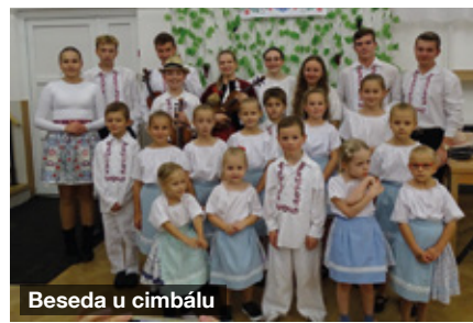
Beseda u cimbálu