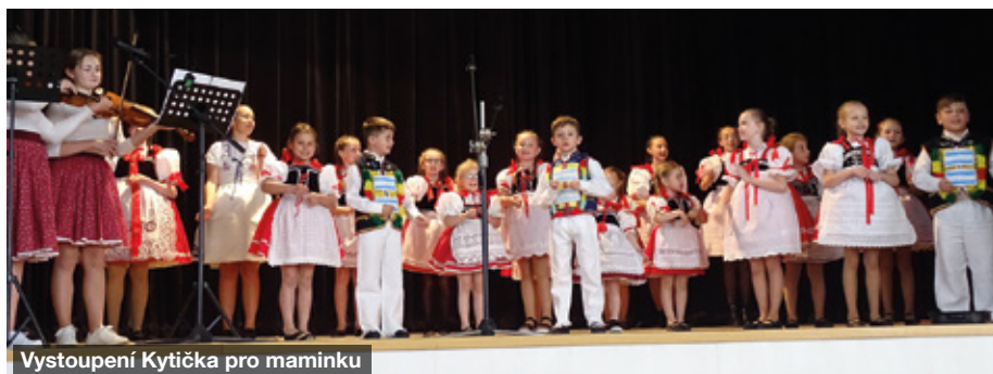
Vystoupení Kytička pro maminku