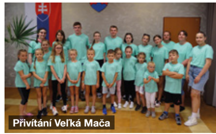
Přivítání Veľká Mača