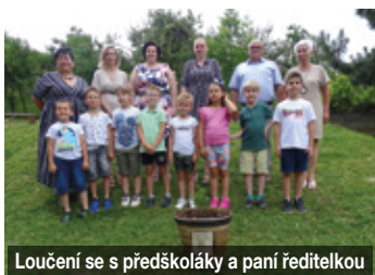
Loučení se s předškoláky a paní ředitelkou