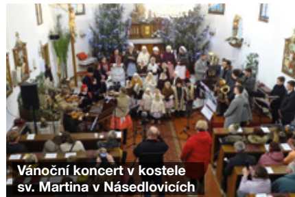
Vánoční koncert v kostele sv. Martina v Násedlovicích