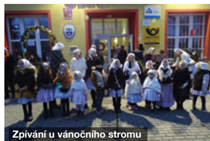
Zpívání u vánočního stromu