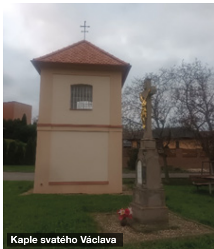
Kaple svatého Václava

Obecní zvonice, nyní kaple sv. Václava. Nachází se v Dědině, naproti bývalým budovám zemědělského družstva. Stavbu zvonice nařídila kdysi císařovna Marie Terezie ve svém „ohnovém patentu“, který ukládal obcím povinnost varovat zvonem v případě požárů. První zmínka o zvonici v Násedlovicích je z roku 1825. Naposledy se v ní zvonilo ve svátek sv. Václava 28. září 1928 ráno a pak byly zvony přeneseny do katolického kostela.