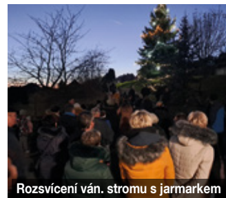
Rozsvícení ván. stromu s jarmarkem

A další akce pořádané spolky, za což jim děkujeme.