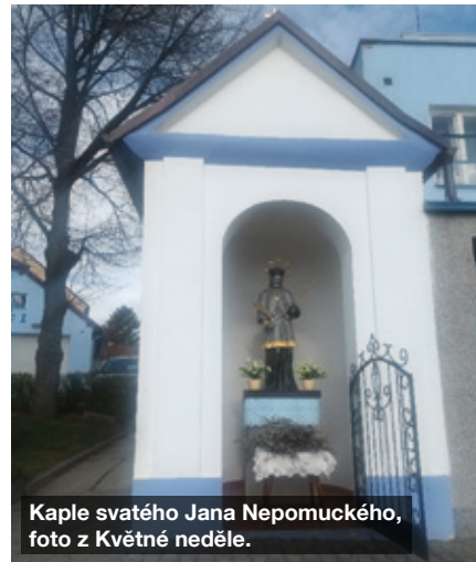
Kaple svatého Jana Nepomuckého, foto z Květné neděle.

Kaple svatého Jana Nepomuckého. Kaple se nachází vedle budovy bývalé hasičské zbrojnice v blízkosti pomníku padlých. Je obdélníkového tvaru, cihlová, bíle omítnutá, modrá podrovnávka, modrá římsa a lemování štítu, na něm dvouramenný železný kříž, obloukovitý výklenek, v něm na podstavci socha svatého Jana Nepomuckého. Na podstavci je nápis: Zbudováno od obce Násedlovice ke cti a chvále Boží r. 1877.