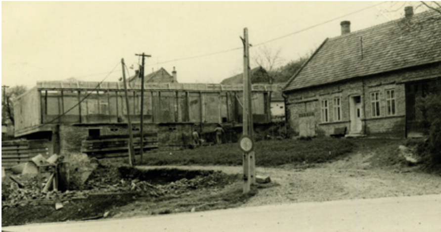
Foto původní Jirkovy kovárny nemáme. Stála u cesty v sousedství dnešní prodejny COOP (foto zachycuje stavbu prodejny, která původně patřila Jednotě). Nový majitel, Josef Krhánek, přenesl kovárnu do svého nově postaveného domu – viz foto.