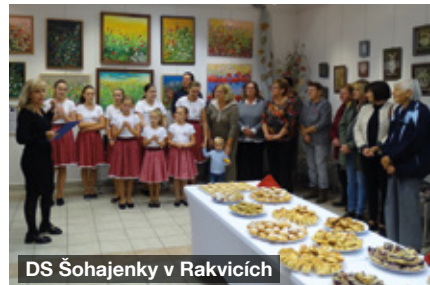
DS Šohajenky v Rakvicích