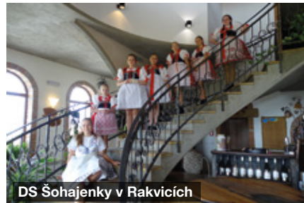
DS Šohajenky v Rakvicích