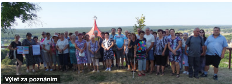
Výlet za poznáním