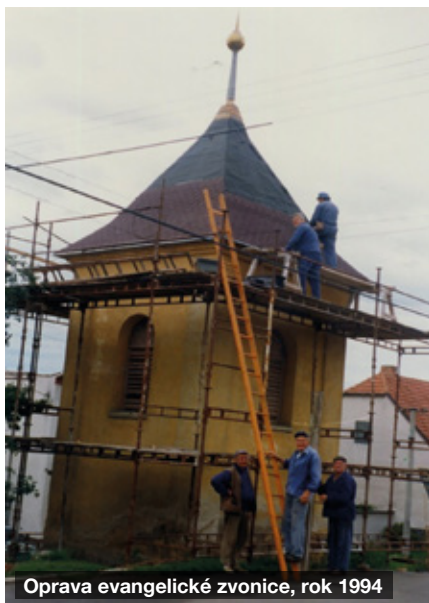
Oprava evangelické zvonice, rok 1994

Členové evangelické církve se také starají o údržbu obou budov, chodníku a k tomu pečují o zahradu za modlitebnou. Za tuto mnohaletou práci bych chtěl na tomto místě poděkovat především manželům Hrdličkovým. Udržování chodníku před modlitebnou hlavně v zimním období je po celá léta pro