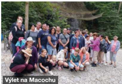
Výlet na Macochu