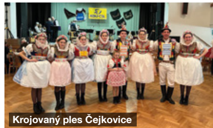
Krojovaný ples Čejkovice