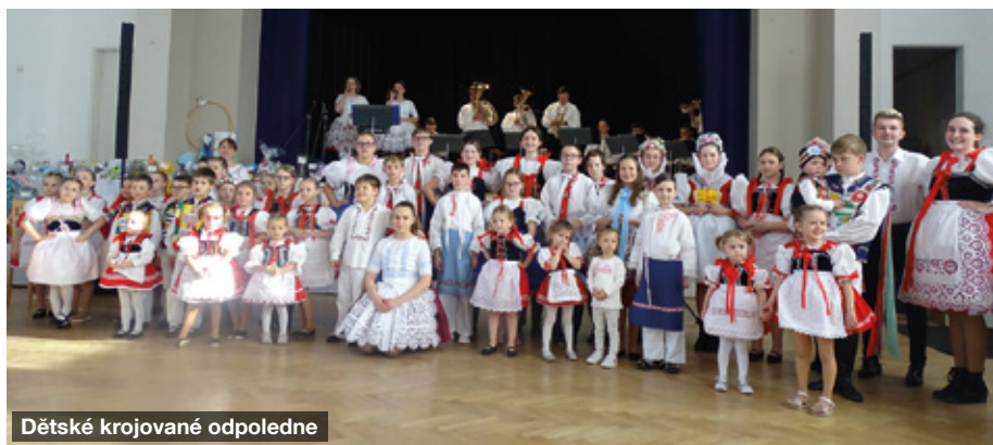
Dětské krojované odpoledne