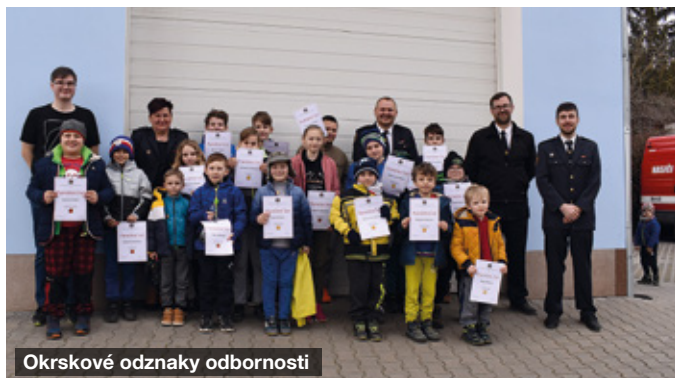
Okrskové odznaky odborností

Provedli jsme také každoroční sběr starého železa, který děláme vždy na jaře. Letos také po odmlce proběhla Okrsková soutěž v požárním sportu. Družstvo dospělých nám udělalo radost a zvítězilo. Družstvo dospělých doplněné dorostenci se účastnilo nočních závodů v Želeticích. Proběhl okrskový zájezd do Moravského Krumlova, kde jsme si prohlédli Slovanskou epopej Alfonze Muchy. V Oslavanech jsme navštívili hasičské muzeum a zájezd ukončili ve sklípku na Vrbici.