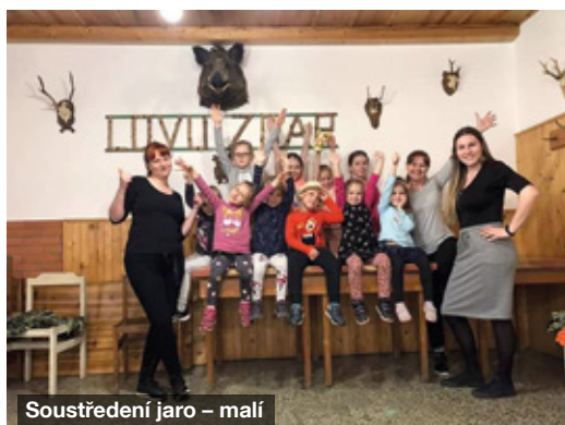
Soustředění jaro – malí