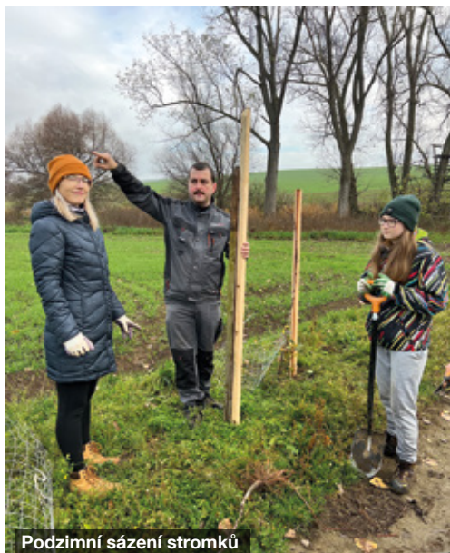
Podzimní sázení stromků