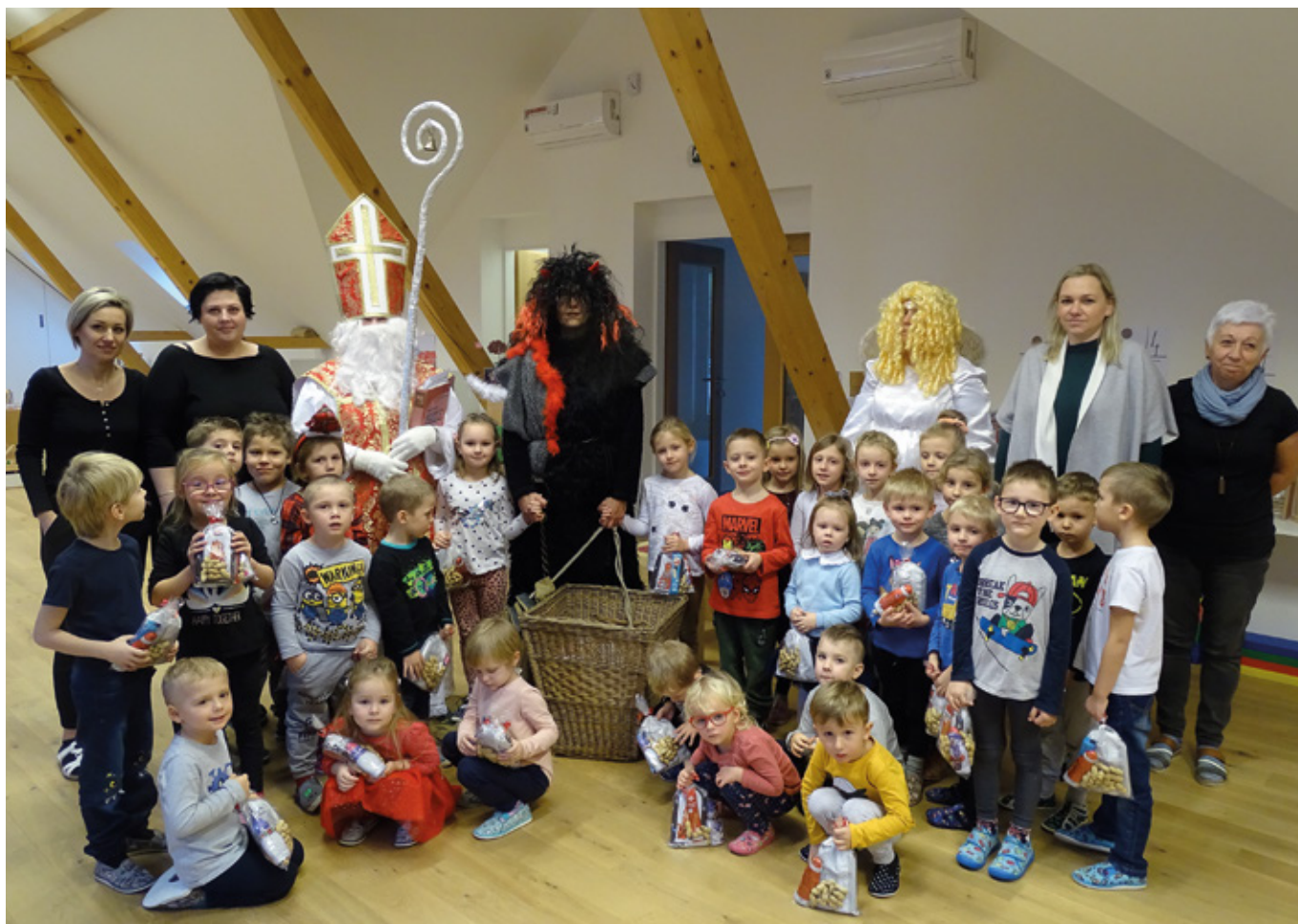
Mikuláš s družinou v školce