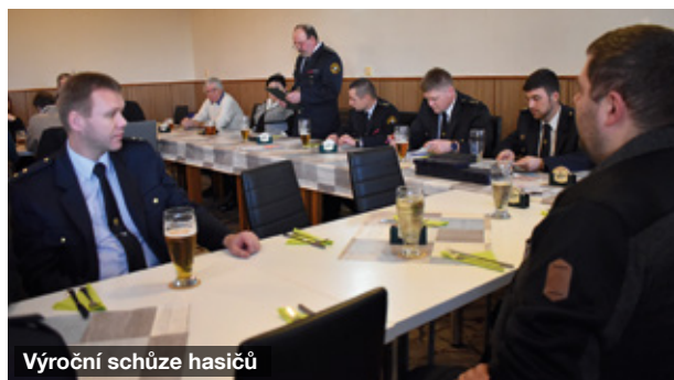
Výroční schůze hasičů