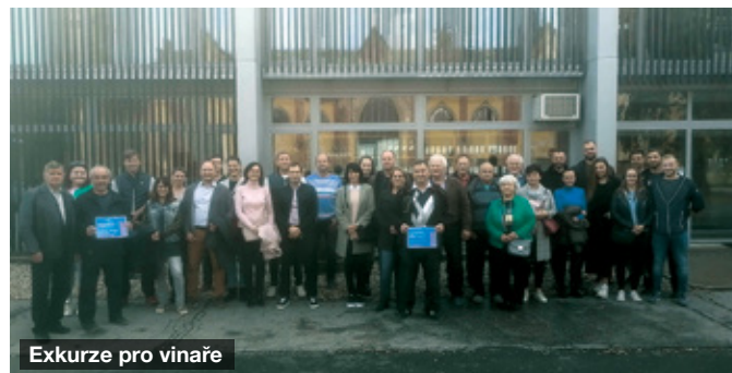
Exkurze pro vinaře