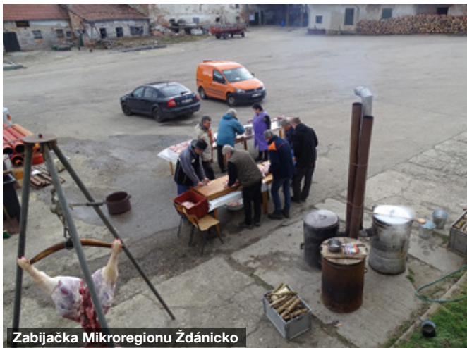
Zabijačka Mikroregionu Ždánicko