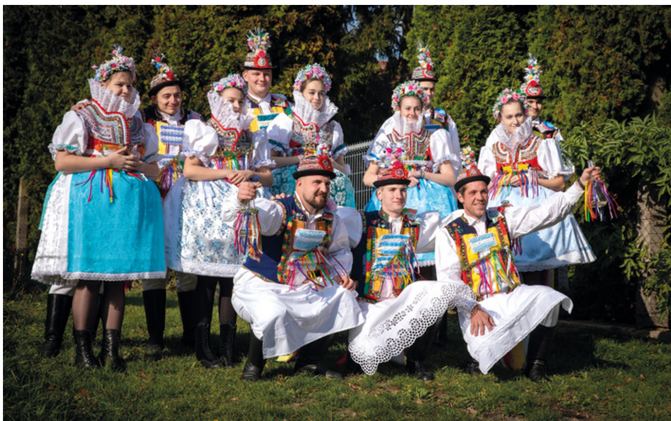
Stárky, stárci a sklepníci