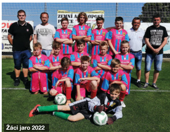
Žáci jaro 2022