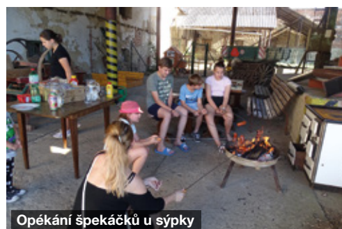
Opékání špekáčků u sýpky