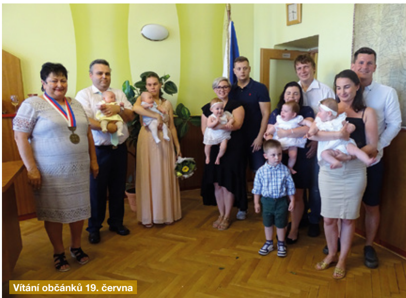
Vítání občánků 19. června