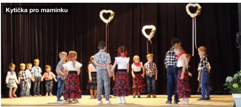
Kytička pro maminku