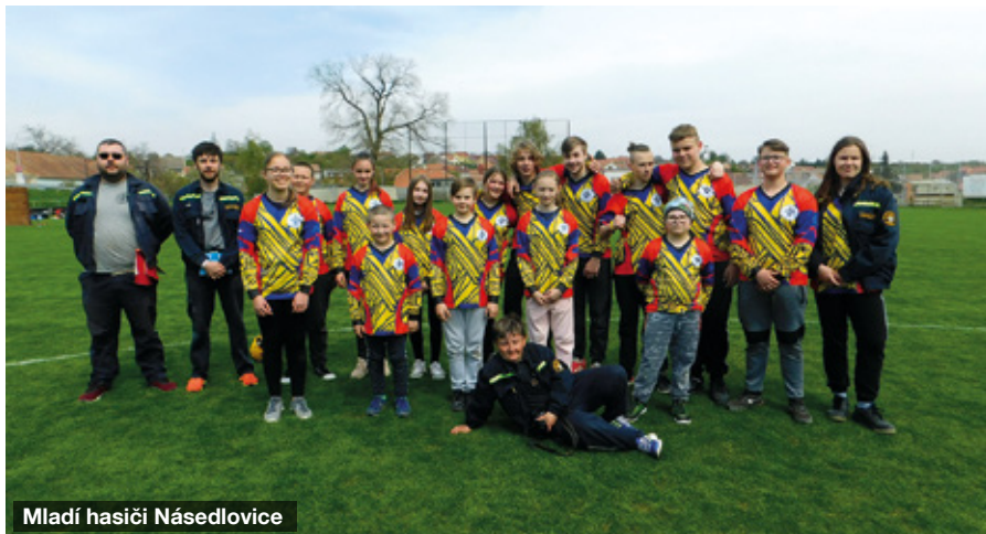
Mladí hasiči Násedlovice

Dětem i vedoucím se moc líbil tento typ výletu, a tak jsem se na konci června, jako rozloučení se sezónou rozhodli uspořádat výlet