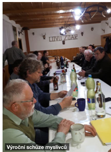
Výroční schůze myslivců

Prvního září uvítala ZŠ Žarošice nové školáky. Koncem září uspořádal Násedlováček tradiční podzimní úklidovou akci. V rámci klubu důchodců jsme připravili růžičky na hody.