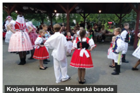
Krojovaná letní noc – Moravská beseda