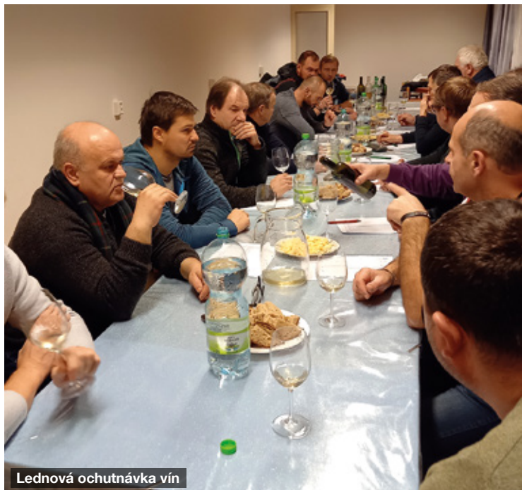
Lednová ochutnávka vín