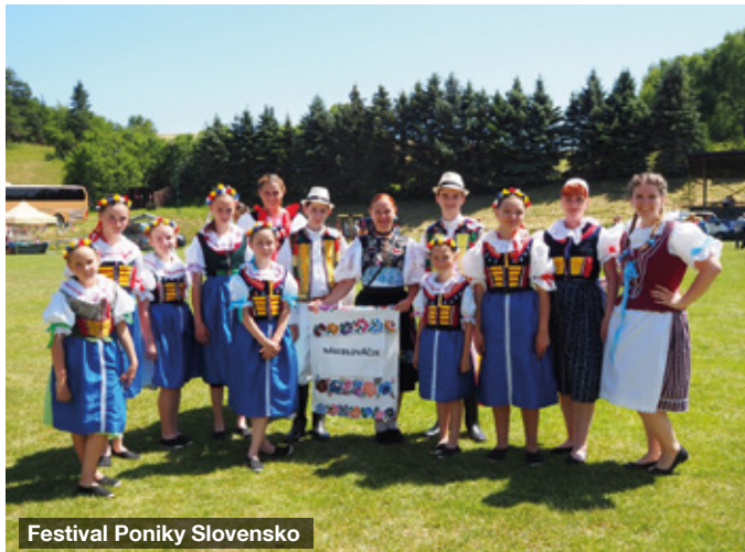
Festival Poniky Slovensko

jim patří velké poděkování. Děkujeme také všem dobrovolníkům, kteří nám s úklidem i přes nepřízeň počasí pomohli. I díky vám máme naši dědinku zase o trochu hezčí!