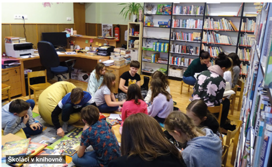
Školáci v knihovně

Kromě těchto technických záležitostí se samozřejmě pořídky i nové knížky, a to nejen pro dospělé čtenáře, ale také pro děti. Prostředky na tyto nákupy pochází z prodeje starých knížek, kterých se prodalo již více než tisíc. I když to nejsou žádné žádané raritní výtisky a větši-