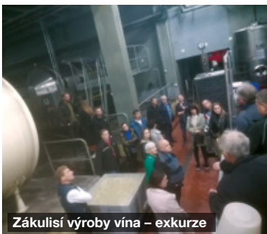
Zákulisí výroby vína - exkurze

s besedou u cimbálu, v pátek 11. 11. 2022, na tradičních martinských hodech. Důvod byl prostý, v loňském roce se akce zdařila, takže by se mohla stát tradicí. Podařilo se nám sehnat 258 vzorků vín mladých i ročníkových, od místních i přespolních vinařů. Všem vinařům za poskytnuté vzorky děku-