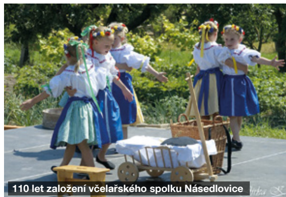
110 let založení včelařského spolku Násedlovic

Druhý folklorní festival, který jsme letos navštívili, byl v Dambořicích. Zde jsme di-