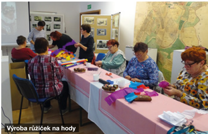
Výroba růžiček na hody