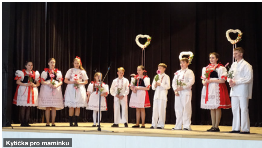
Kytíčka pro maminku