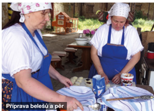
Příprava belešů a pěr

V letošním roce se po delší kovidové pauze začaly pomalu rozjíždět i akce v místním muzeu. První akcí, kterou jsme zorganizovali, bylo ostatkové pečení. Toto pečení se uskutečnilo v kuchyni ve dvoře, protože ani v muzeu a ani na sýpce prostory na pečení a vaření nemáme. Akce proběhla 22. února za hojné účasti místních babiček a maminek. Téma pečení byly boží milosti a koblihy na několik způsobů (se sněhovou pěnou