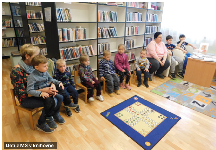
Děti z MŠ v knihovně

nou jde o částku v řádech desetikorun, už se takto získalo třicet pět tisíc korun. A protože ve skládce je ještě cca dva tisíce knížek, v prodejkách a nákupech budeme pokračovat.