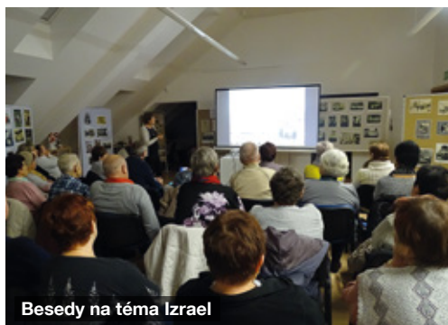
Besedy na téma Izrael