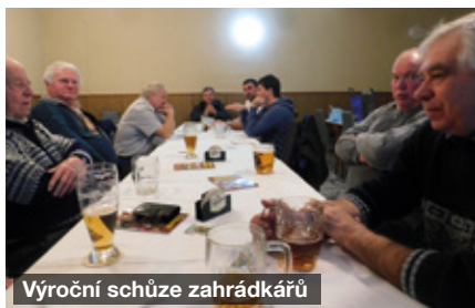
Výroční schůze zahrádkářů

V lednu uspořádali místní zahrádkáři ochutnávku vín na Zemasu. V sobotu 8. ledna proběhla v naší obci Tříkrálová sbírka. Celkem se vybralo rekordních 36 698 Kč. Děkujeme všem Tříkrálovým skupinkám dětí a mládeže, které s písní obcházely obec. Začátek kalendářního roku tradičně patří výročním schůzím - přikládáme fotografie ze schůzí hasičů, zahrádkářů a včelařů. Dne 11. 2. 2022 proběhla v kostele sv. Martina ekumenická bohoslužba. Dne 19. 2. proběhlo v sále KD opožděné vynášení máje. Dne 22. 2. proběhlo Ve dvoře pečení ostatkových dobrot - milostí a koblih. O pečení byl velký zájem a všechny připravené dobroty se rychle snědly. Šikovné zázemí areálu Ve dvoře bylo využito ještě