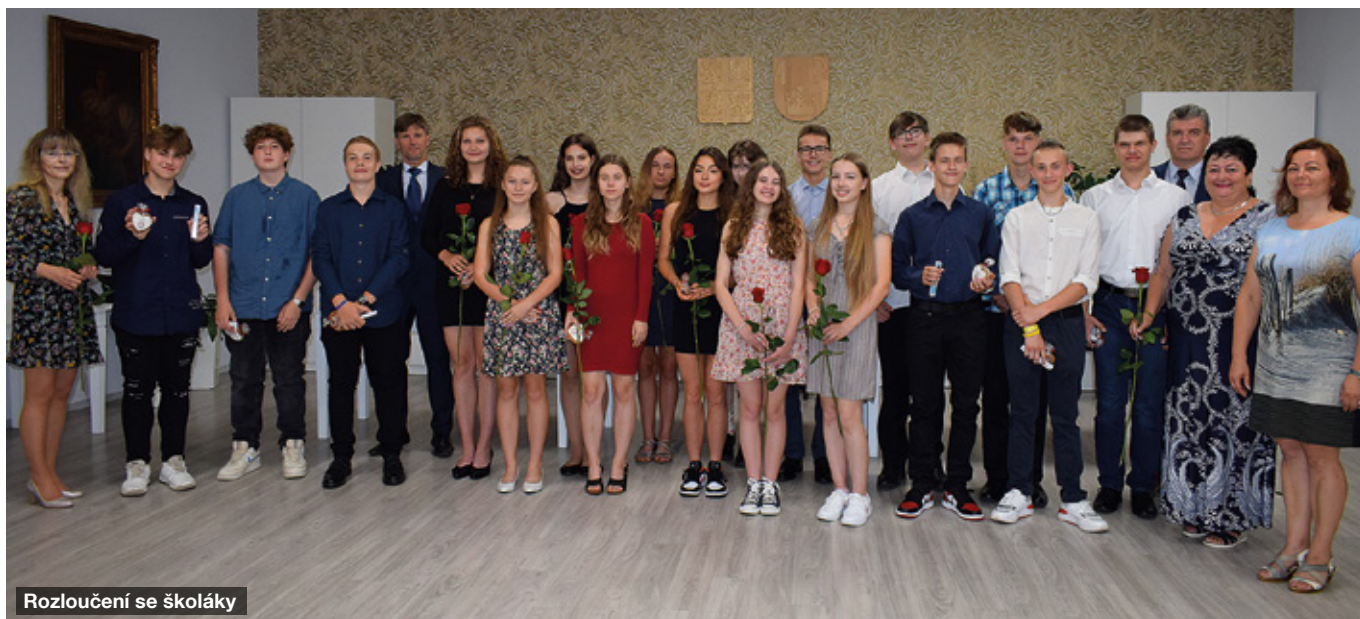
Rozloučení se školáky