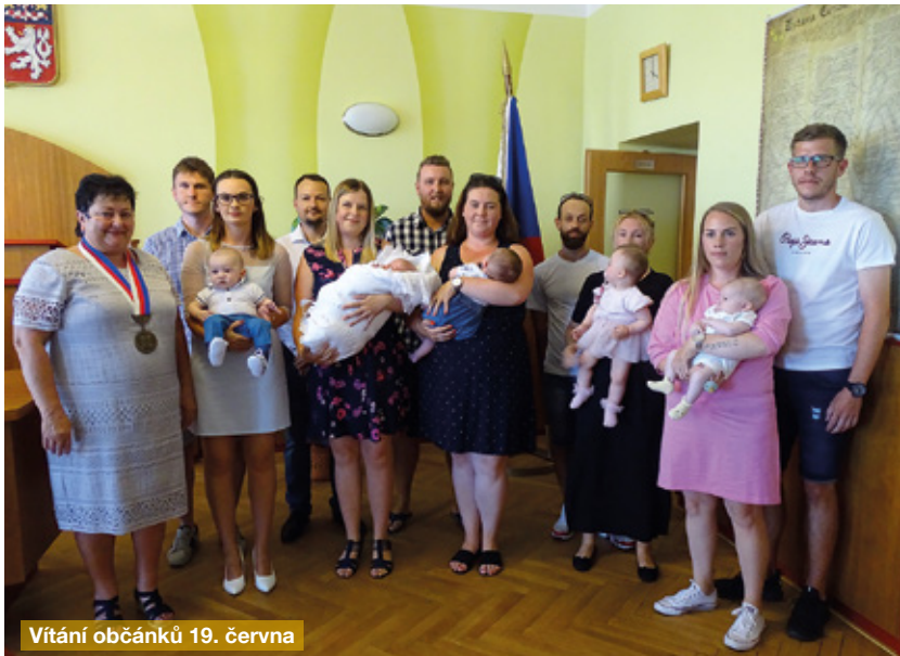
Vítání občánků 19. června