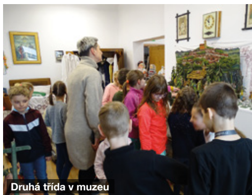
Druhá třída v muzeu