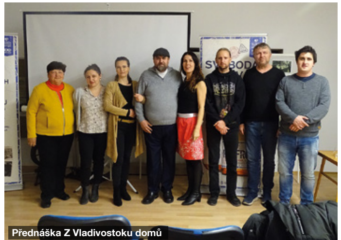
Přednáška Z Vladivostoku domů

a potravinová sbírka. Díky ochotě občanů Násedlovic i okolních vesnic byly všechny potřebné věci shromážděny a ubytovna se postupně zaplnila ukrajinskými rodinami. Rodinám jsme také pomohli s vyřízením víz a dalších záležitostí, později jsme dětem zařídili docházku do školy a školky a maminkám výuku češtiny. Některé rodiny se však do běžného života zapojit nechtěly a brzy odjely. S koncem roku zůstávají v naší obci pouze dvě rodiny - jedna v ubytovně, druhá se osamostatnila a bydlí v pronajatém domě. Trochu nás mrzí, že s odchodem rodin zmizelo i dost vybavení a darů od občanů,