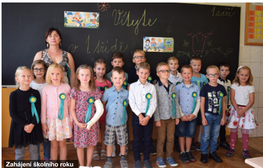
Zahájení školního roku