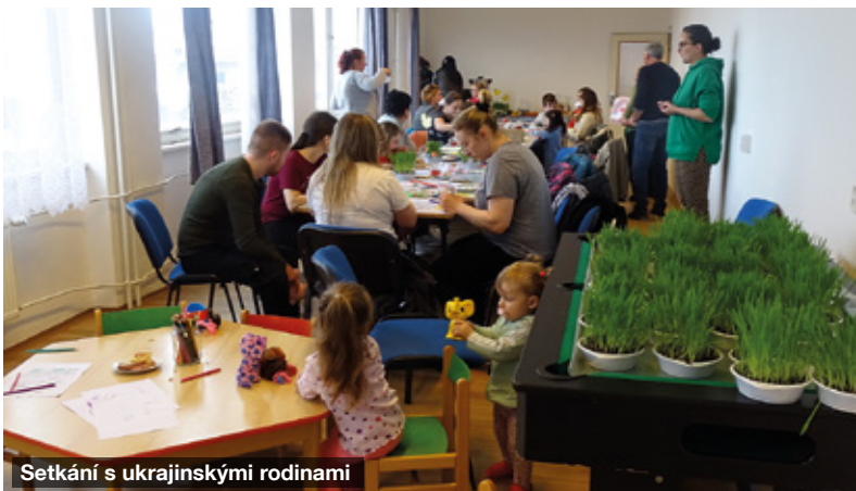
Setkání s ukrajinskými rodinami