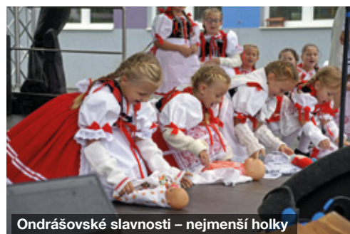
Ondrášovské slavnosti – nejmenší holky