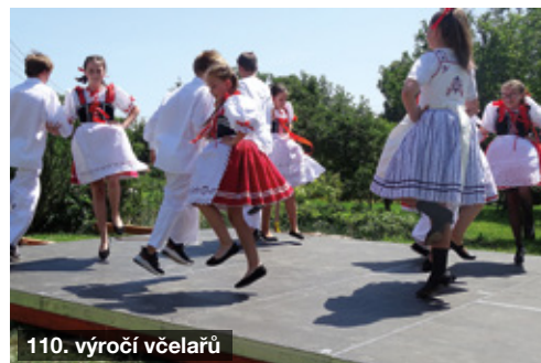
110. výročí včelařů