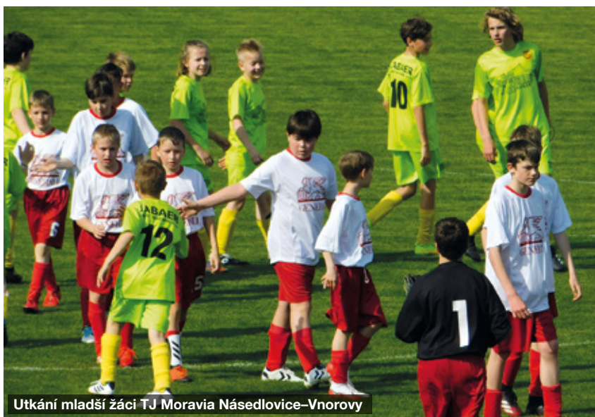
Utkání mladší žáci TJ Moravia Násedlovice-Vnorovy