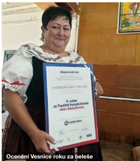
Ocenění Vesnice roku za beleše