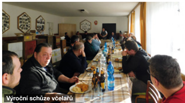
Výroční schůze včelařů