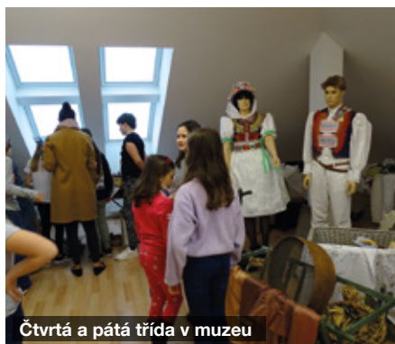
Čtvrtá a pátá třída v muzeu