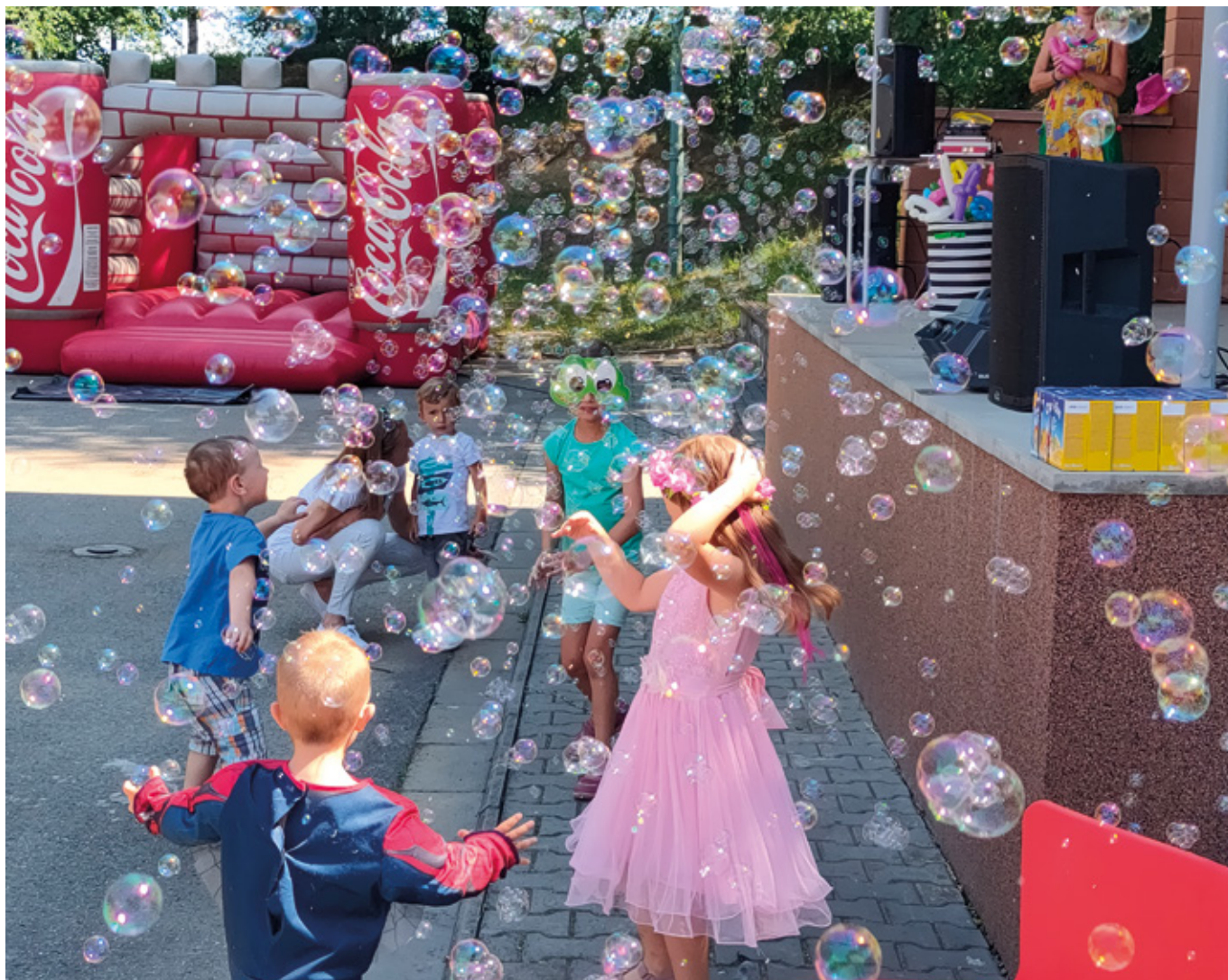
Dětský den s maškarním