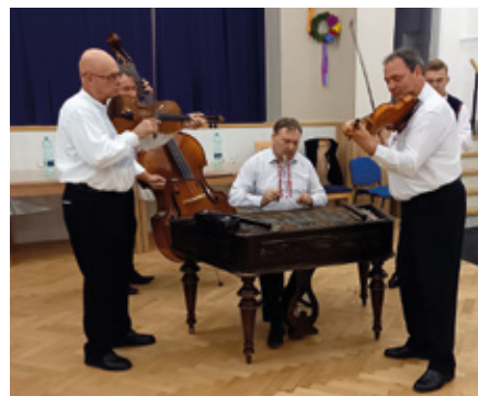
CM Dukát na hodovém koště vína