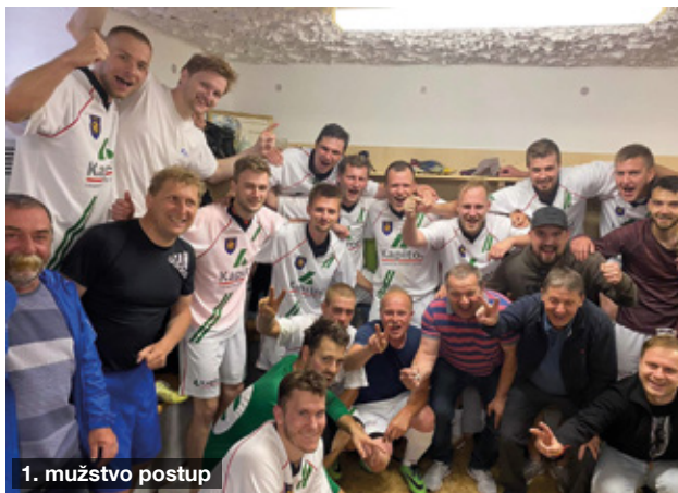
1. mužstvo postup

Přípravná utkání, celkem pět, jsme začali hrát od poloviny února a 3. dubna jsme jeli k prvnímu mistrovskému utkání do Čejče. Jen připomínám, že po podzimu jsme měli 6 bodů náskok na druhého. Utkání jsme zvládli, vyhráli 3:0. A první a jedinou prohru jsme zaznamenali až v posledním kole