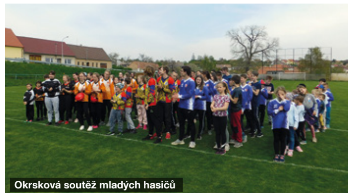
Okrsková soutěž mladých hasičů