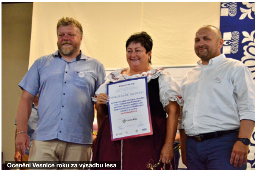
Ocenění Vesnice roku za výsadbu lesa