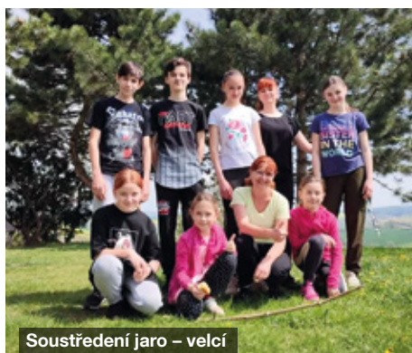
Soustředění jaro – velcí