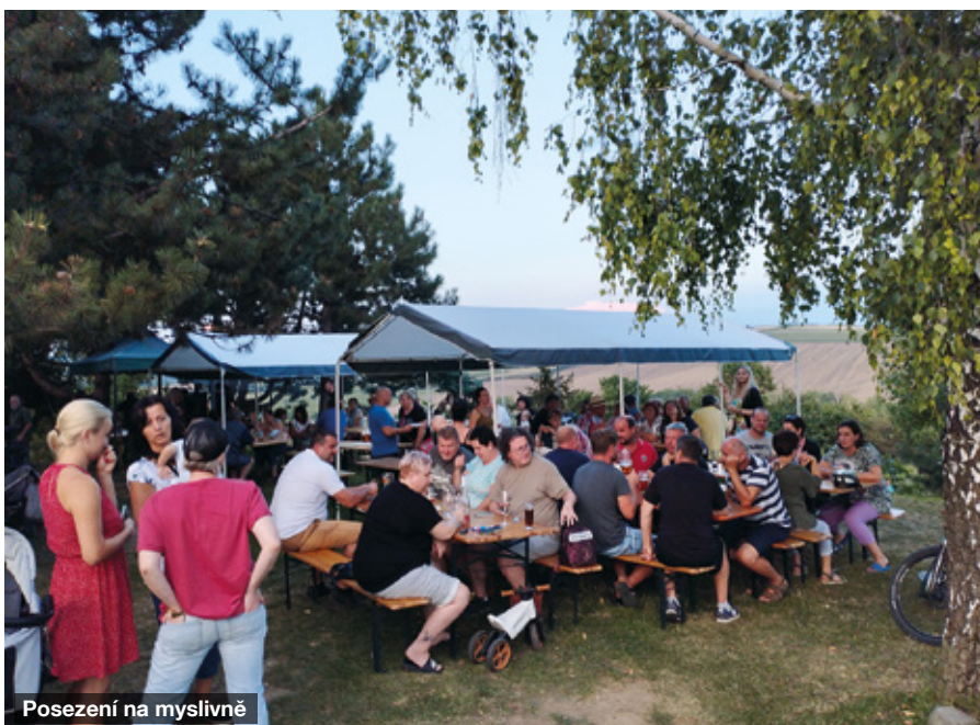
Posezení na myslivně