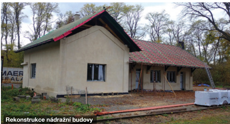
Rekonstrukce nádražní budovy