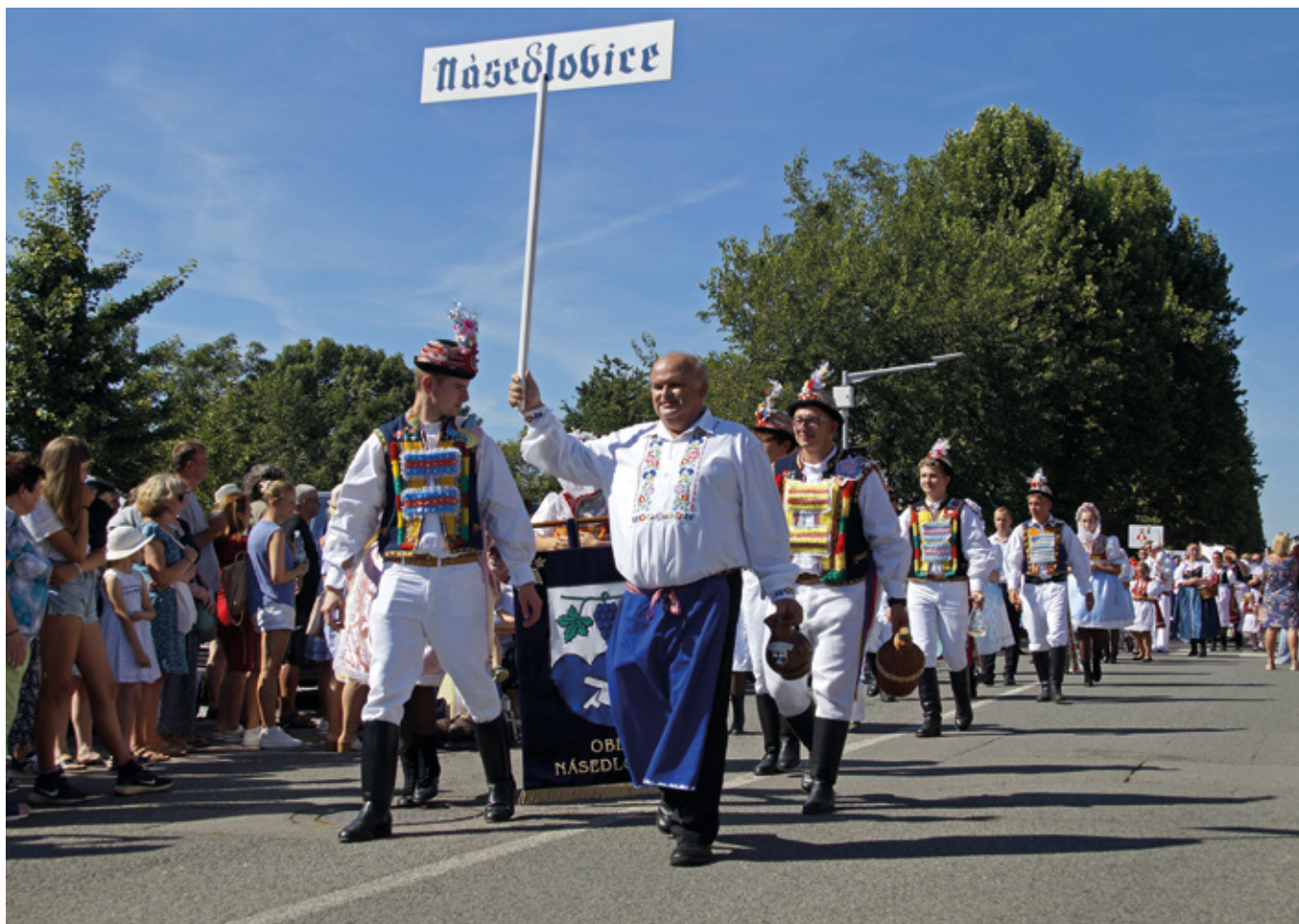
Slovácky rok – průvod