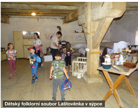
Dětský folklorní soubor Laštovénka v sýpce

V galerii probíhají i cestopisné přednáš-