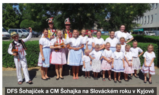
DFS Šohajíček a CM Šohajka na Slováckém roku v Kyjově