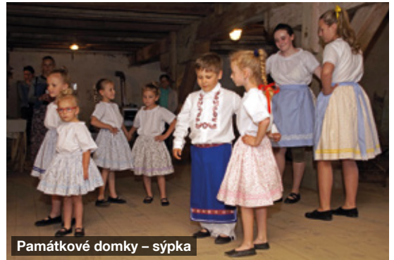
Památkové domky – sýpka