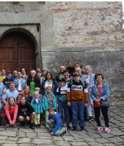
Výlet na ukončení prázdnin

V červnu akční skupina Kyjovské Slovácko v pohybu pořádala v naší obci výtvarné odpoledne