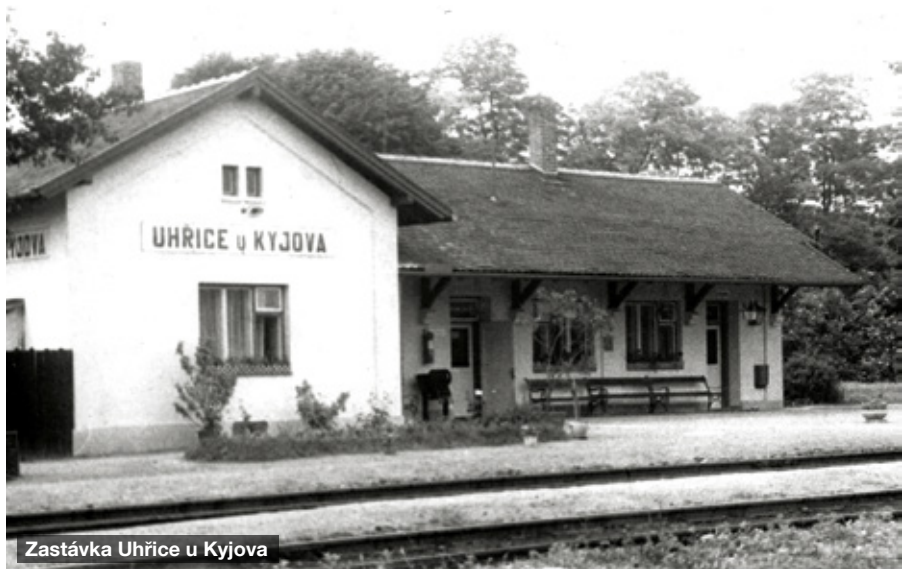
Zastávka Uhřice u Kyjova

Tato lokální dráha měla smůlu, že se vyhýbala centřům obcí a majitel cukrovaru pan Eduard Seidl ji nechal postavit v letech 1906–1908 poblíž svých pozemků, hlavně pro zásobování cukrovaru ve Ždánicích řepou. Osobní doprava, tedy provoz smíšených vlaků byl zahájen o rok později. Během doby osobní vlaky pomalu, ale jistě začala vytěšňovat rychlejší autobusová doprava, která zajížděla přímo do středu obcí. Zajímavostí je, že občané Dambořic pracující ve Ždánicích přestože z Dambořic do Ždánic jezdil autobus, byly nuceni jezdit do Ždánic motoráčkem. Autobus je sice zavezl z Dambořic k zastávce vlaku, (cca 0,5 km za „Trhanovem“), kde museli vystoupit a přejít polní cestou na zastávku Dambořice z důvodu nízké kapacity autobusových spojů, protože už by se do nich nevešli cestující z Uhřic, Žarošic a Archlebova. Zpátky zas cestovali stejným způsobem. Lokálka