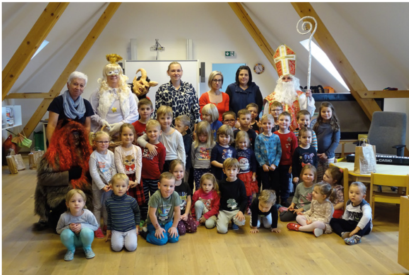
Mikuláš s družinou ve školce