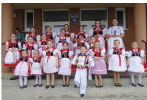
Cimbálová muzika Šohajka