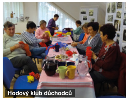
Hodový klub důchodců

pro seniory. Zde si mohli namalovat látkové tašky pod odborným vedením lektorky. Materiál i občerstvení pro všechny účastníky byl zabezpečen z dotace, kterou Kyjovské Slovácko obdrželo na dobu více let.