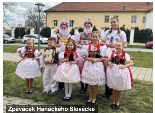
Zpěváček Hanáckého Slovácka