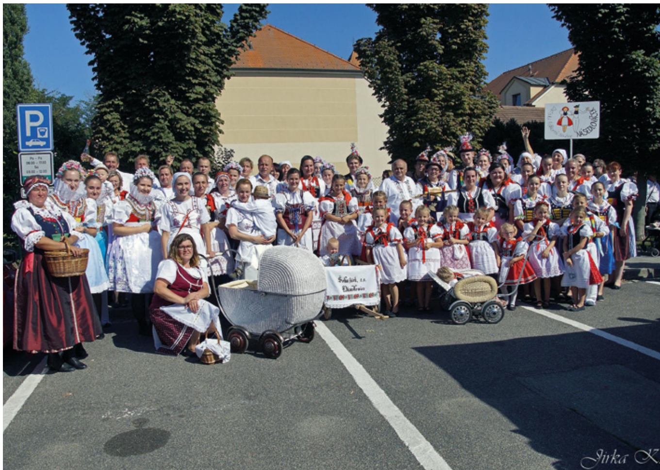
Slovácky rok – chasa