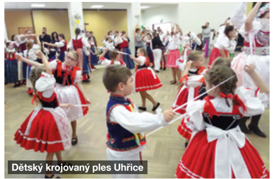
Dětský krojovaný ples Uhřice