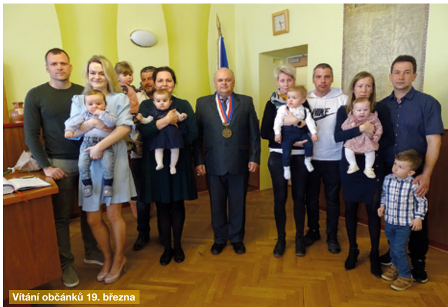
Vítání občánků 19. března