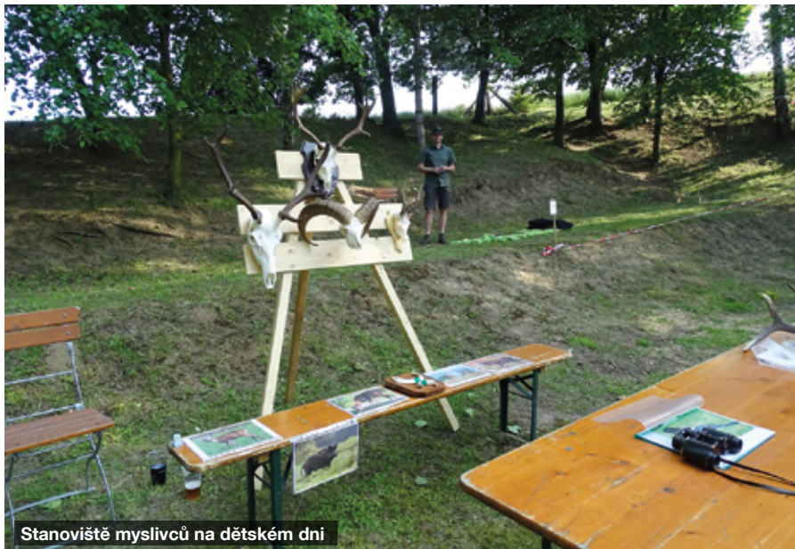
Stanoviště myslivců na dětském dni

V měsíci červnu jsme se rádi zúčastnili dětského dne a připravili dětem dvě soutěžní stanoviště, kde jsme našim nejmenším