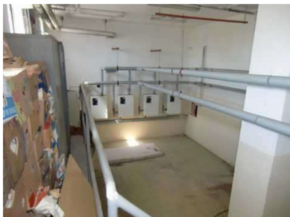
interiér obj. 04