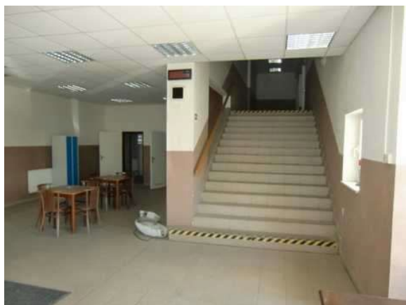
interiér obj. 04