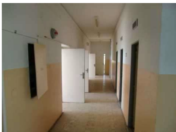
interiér obj. 04