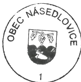
Vlasta M o k r á

Záměr obce o prodej nemovitého majetku bude podle § 39 odst. č. 1 zákona č.128/2000 Sb., o obcích zveřejněn nejméně po dobu 15-ti dnů před jeho projednáním obecním zastupitelstvem. Občané se mohou k tomuto záměru vyjádřit, popř. předložit své připomínky na Obecním úřadě v Násedlovicích.